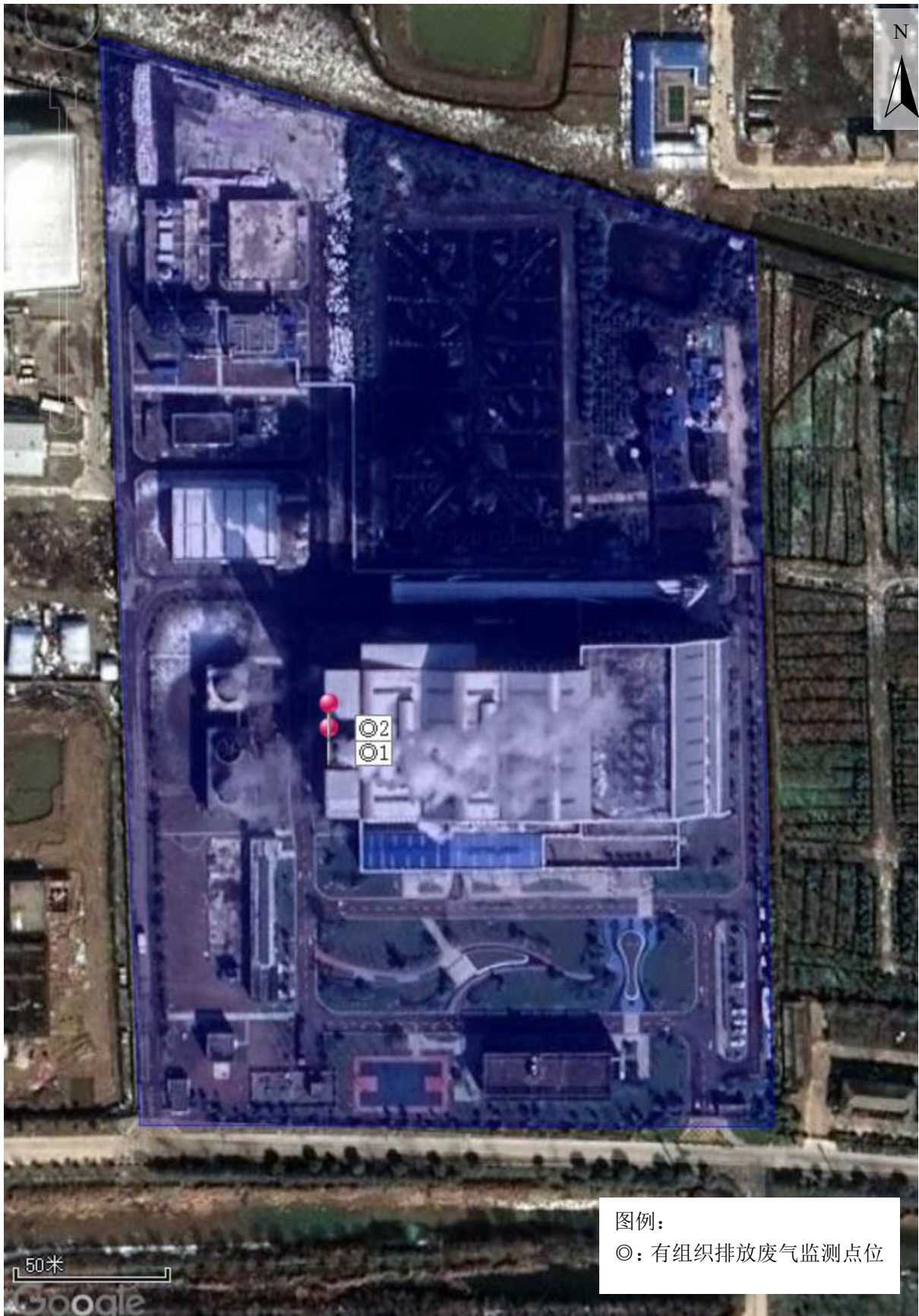
附图 1：监测点位示意图